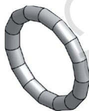
Těsnicí O-kroužek LBP